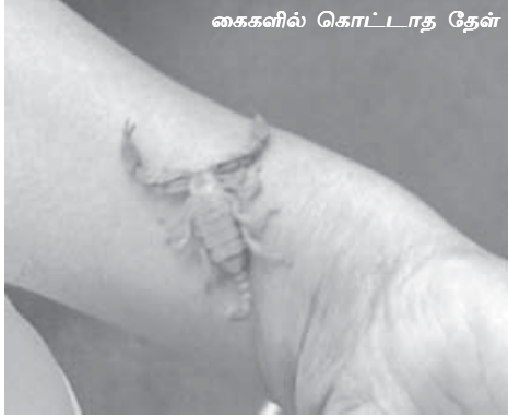
கைகளில் கொட்டாத தேள்

நீங்கள் மரணித்தால் உங்கள் கப்ரைச் சுற்றிலும் கழுதைகள் உலா வரும் என்றார்கள். அதற்கு நஸூருத்தீன் ஓலியுல்லாஹ் அவர்கள், “நீங்கள் சொன்னால் அது நடக்கத் தான் செய்யும். ஆனால் கழுதைகள் என் எல்லையில் மல ஜலம் கழிக்காது!” என்றார்கள்.