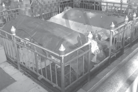
ஹஜ்ரத் அவர்களின் புனித மஜார் - அம்ரூஹா