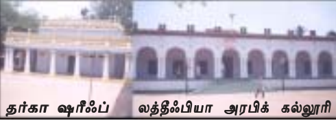
தர்கா ஷரீஃப் லத்தீஃபியா அரபிக் கல்லூரி