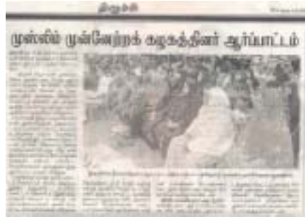
நன்றி: தினமணி - 6, டிசம்பர் 2010

தர்காவிற்குச் சென்று ஒரு ஓரமாக உட்கார்ந்து யானின், தபாரக் குரா ஒதி அவுலியாக்கள் பேரில் ஃபாத்திஹா படித்து வல்ல அல்லாஹ்விடம் துஆ செய்வது ஹராம் ஷரீக் - பித்அத். ஆனால் நட்ட நடு ரோட்டில் பட்டப்பகலில் பல டி.வி. சேனல்கள் வீடியோ எடுக்க பெண்கள் போராடுவோம்! போராடுவோம்!! என ஆர்ப்பாட்டத்தில் ஈடுபடுவது பக்கா தவ்ஹீதா? அனாச்சாரமா?