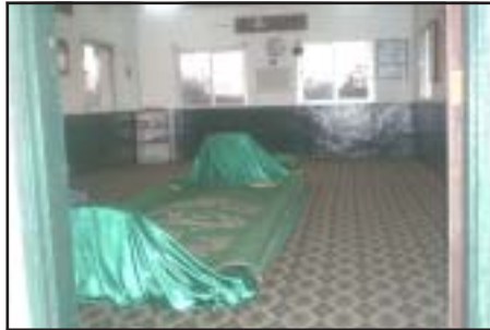
ஹஜ்ரத் அய்யூப் அலைஹிஸ் ஸலாம் அவர்களின் தர்கா ஷரீஃப் - நாடு ஓமன்

மதிய உணவுவிற்குப் பிறகு ஹஜ்ரத் இம்ரான் அலைஹிஸ் ஸலாம் அவர்களின் ஜியாரத்திற்குச் சென்றோம். மாலை நேரம் மக்கள் கூட்டம் மிக அதிகமாக இருந்தது.