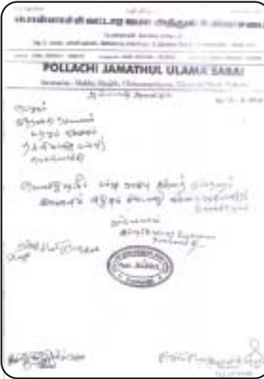
ஜமாஅத்துல் உலமா லெட்டர்பேடிஸ் மூன்று முல்லாக்கள் கக்கிய வஹ்ஹாய்ய விஷயம்.

குறிப்பு : இந்த விளக்கம் திருப்தி அடையாத பட்சத்தில் மேற்கொண்டு விளக்கம் தேவைப்பட்டால் அரபிக் கல்லூரிகளை தொடர்பு கொண்டு