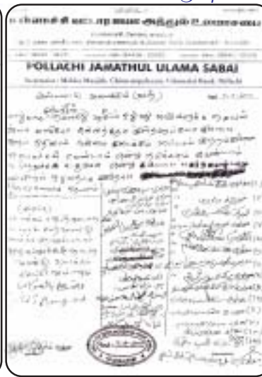
வஹ்ஹாய்ய முல்லாக்களை காப்பாற்ற பொள்ளாச்சி ஜமாஅத்துல் உலமா கொடுத்த முரண்பட்ட கடிதம்