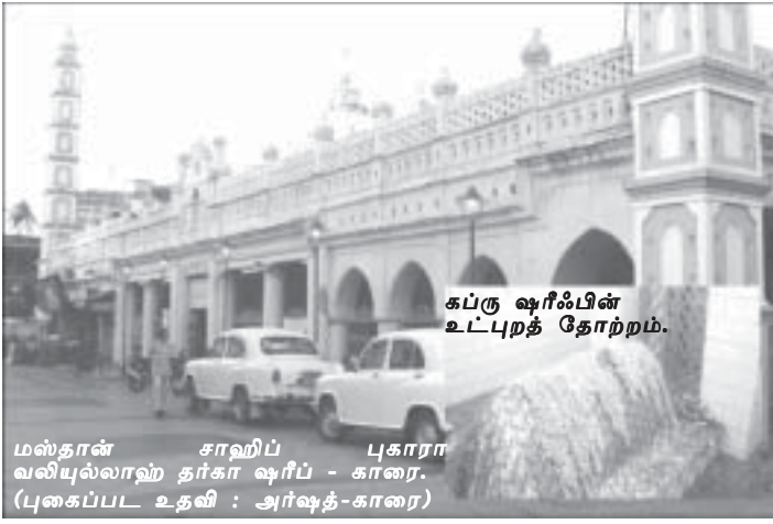
மஸ்தான் சாஹிப் புகாரா வலியுல்லாஹ் தர்கா ஷரீப் - காரை.

நிலையில் முழு நிறைவு பெற்ற செய்யிது ஷாஹ் இமாம் திவான் மஸ்தான் தாவூத் புகாரி என்ற சிறப்புப் பட்டத்துடன் வலியுல்லாஹ்வின் புகழ் அக்கம் பக்கமெல்லாம் பரவி வந்தது. பொதுவாக வலிமார்கள் கராமத் என்னும் அற்புத செயல்கள் வெளிப்படுவதைக் கொண்டு நாணமுறுவர். இறைவணக்கத்தில் முழுகியிருந்த வலியுல்லாஹ் அவர்கள் அப்போது அல்லாஹ்வின் நாட்டப்படி அற்புத செயல்கள் ஆற்றி மக்களின் குறைகளையும் தீர்க்க முடியா - மனித சிந்தனைக்கு அப்பாற்பட்ட பிணிகளையும் - துயரங்களையும் களைந்தார்கள்.